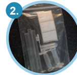
Proovikatsutid (3x), kõrred, kleebisid