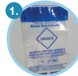
1 kaitsekott koos absorbeeruva padjaga