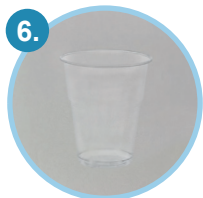
1 Uriini proovi tops